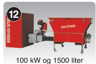
100 kW og 1500 liter