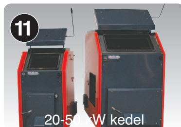
20-50 kW kedel