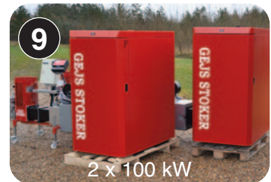
2 x 100 kW