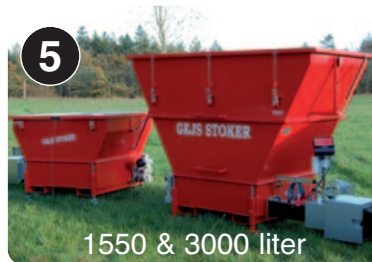
1550 & 3000 liter