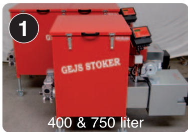
400 & 750 liter