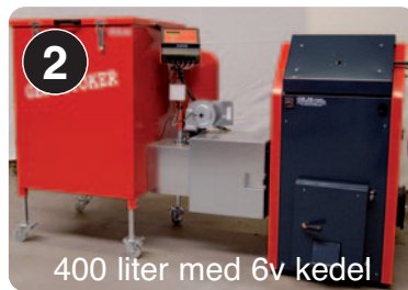
400 liter med 6v kedel